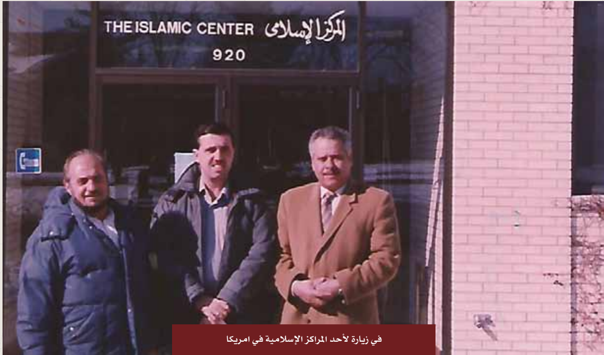
في زيارة لأحد المراكز الإسلامية في أمريكا