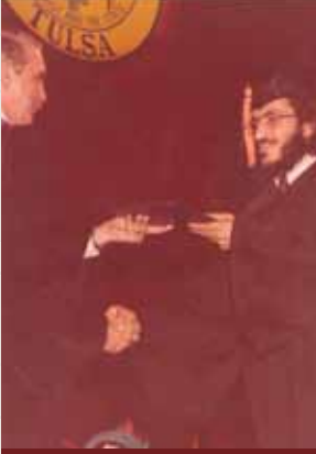
في حفل تخرجه من الجامعة و حصوله على شهادة الهندسة الميكانيكية من جامعة تلسا بولاية اوكلاهوما الأمريكية بتاريخ ٢٩ مايو ١٩٧٧م.