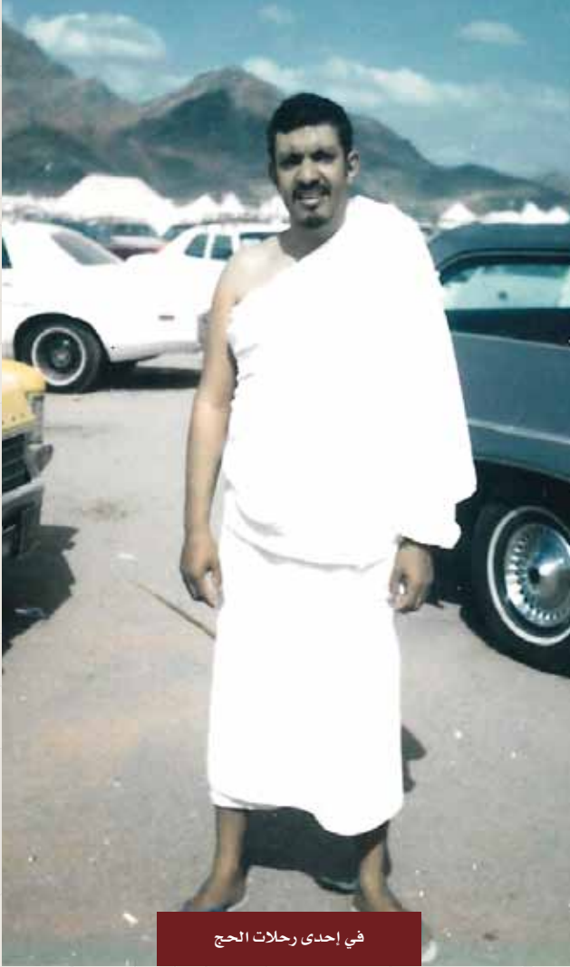
في إحدى رحلات الحج

الدايل، وتشارك في الرحلات الصيفية إلى جزيرة فيلكا المتضمنة النشاط الثقافي والرياضي، وكان يحدثنا عن النشاط الإسلامي في أمريكا بصفة عامة، وهو من أوائل مؤسسي الرابطة الطلابية العربية الإسلامية هناك.