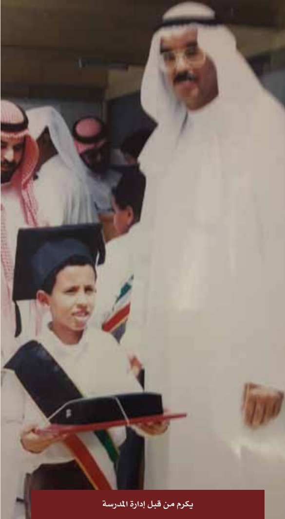
يكرم من قبل إدارة المدرسة

أبدأ موضوعي عن أخ عزيز عليّ، لعلّ كتابتي لهذا الموضوع يحيي داخلي الحس الدعوي، وأيام الإيمانيات، واقتناص الأجر، أسأل الله أن يغفر له ويغفر لنا جميعاً.