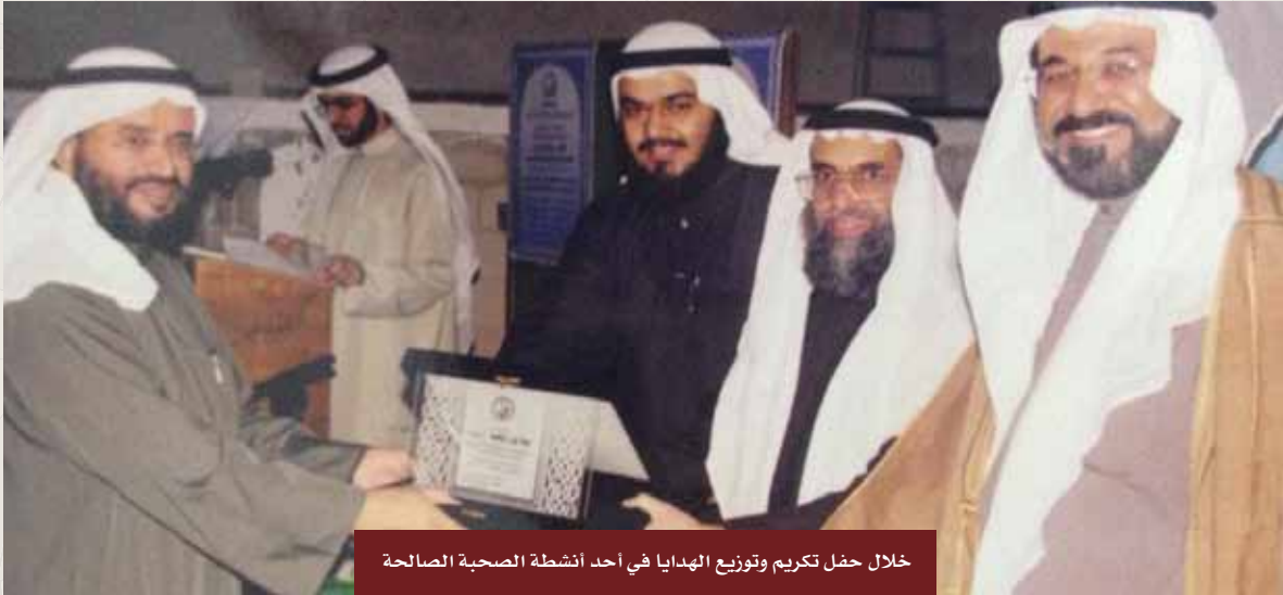
خلال حفل تكريم وتوزيع الهدايا في أحد أنشطة الصحة الصالحة