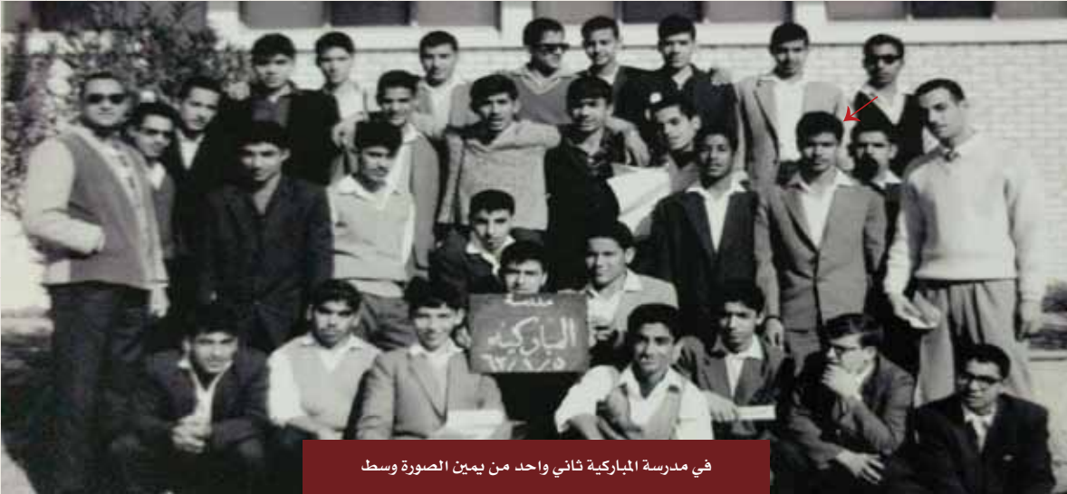
في مدرسة المباركية ثاني واحد من يمين الصورة وسط

رحمك الله يا أبا عبدالله، وأسكنك فسيح جناته، فكنتم نعم الأخ ونعم القدوة.