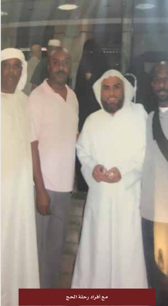
مع أفراد رحلة الحج