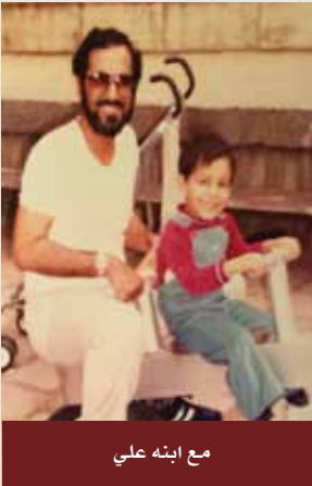
مع ابنته علي