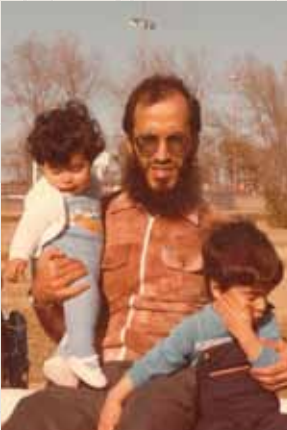
مع ابنيه في أمريكا أيام الدراسة