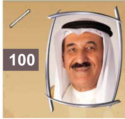
رشيد علي العبد الجادر