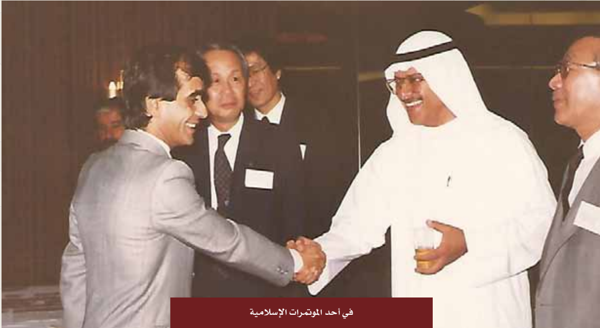
في أحد المؤتمرات الإسلامية

وأضاف الشطي: عندما جاء الكوريون في السبعينيات عبر شركات المقاولات كانت هناك مشكلة التواصل اللغوي مع العمالة الكورية، فكان من ضمن المؤسسين والمنفذين لفكرة تعليم الكوريين اللغة العربية والهدف هو التواصل بين المسؤولين في وزارة الإسكان (هيئة الإسكان في ذلك الوقت)