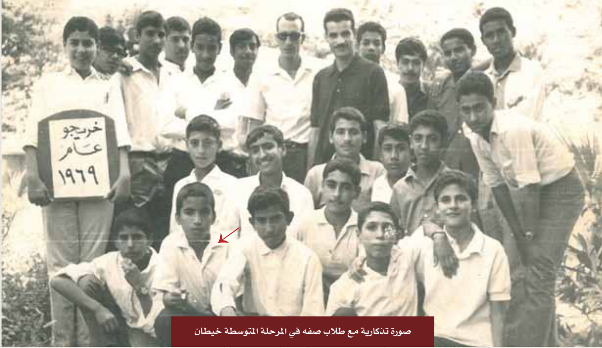
صورة تذكارية مع طلاب صفه في المرحلة المتوسطة خيطان