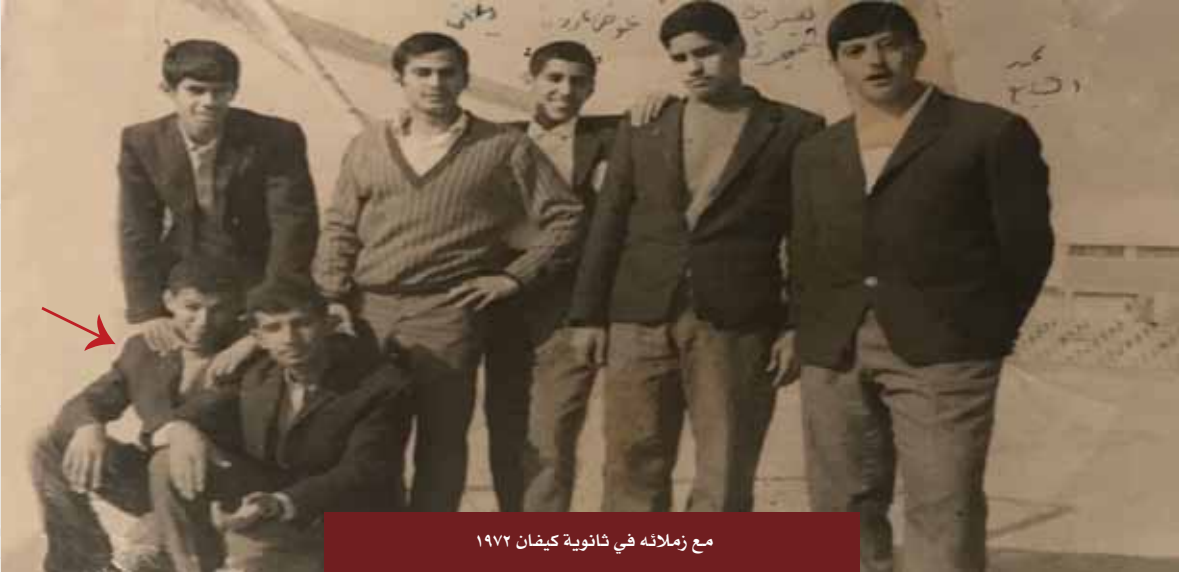
مع زملائه في ثانوية كيفان ١٩٧٢

عمل بعد تخرجه مباشرة في وزارة التجارة، وكان -رحمه الله- يطمح باستكمال تعليمه للحصول