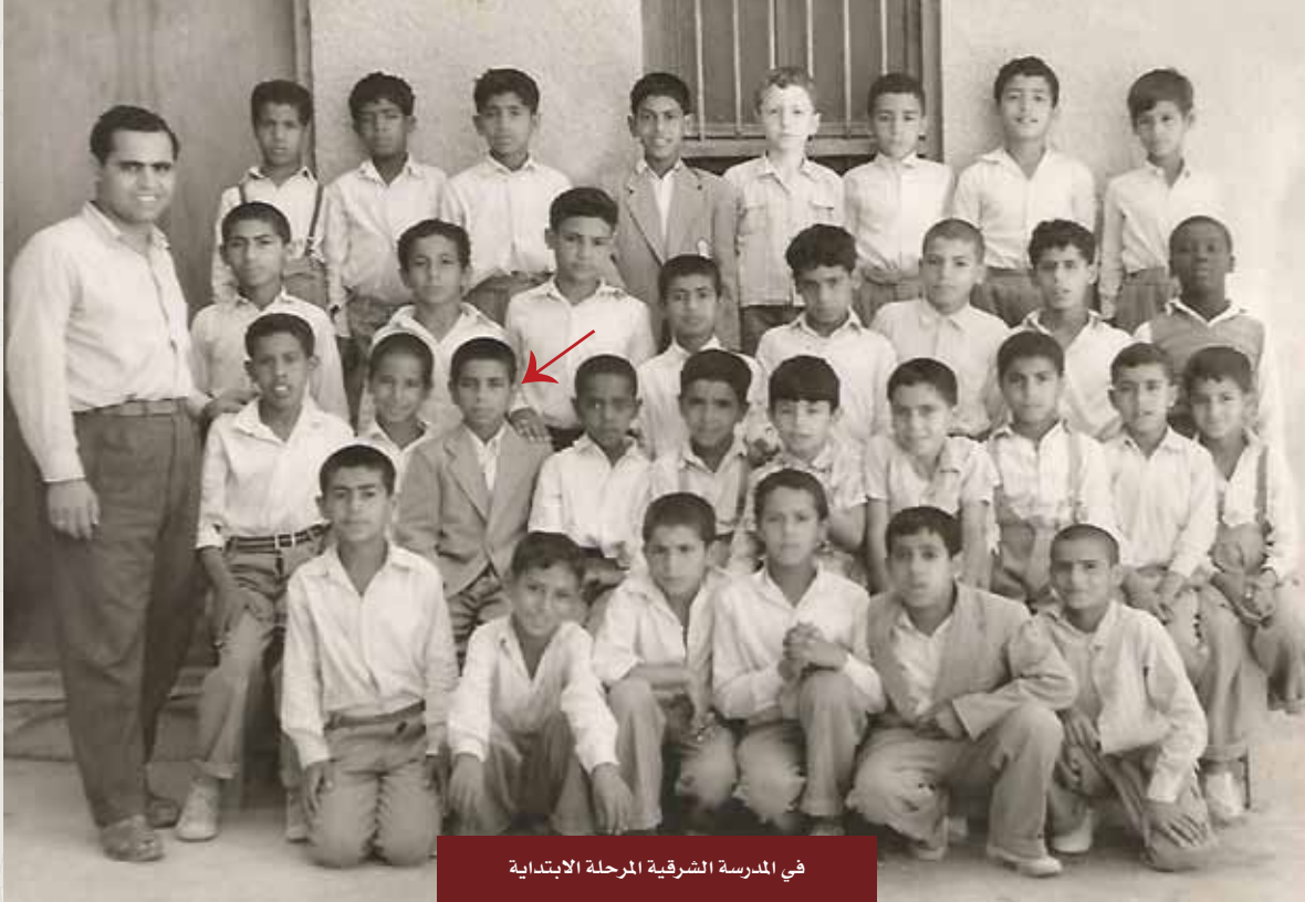
في المدرسة الشرقية المرحلة الابتدائية

درس الابتدائية في مدرسة الشرقية، والثانوية في ثانوية الشويخ، ثم درس اللغة الإنجليزية في بريطانيا، وترك الدراسة واتجه لإدارة أعمال والده بعد وفاته، ثم اشتغل بالأعمال الحرة، حتى وافته المنية.