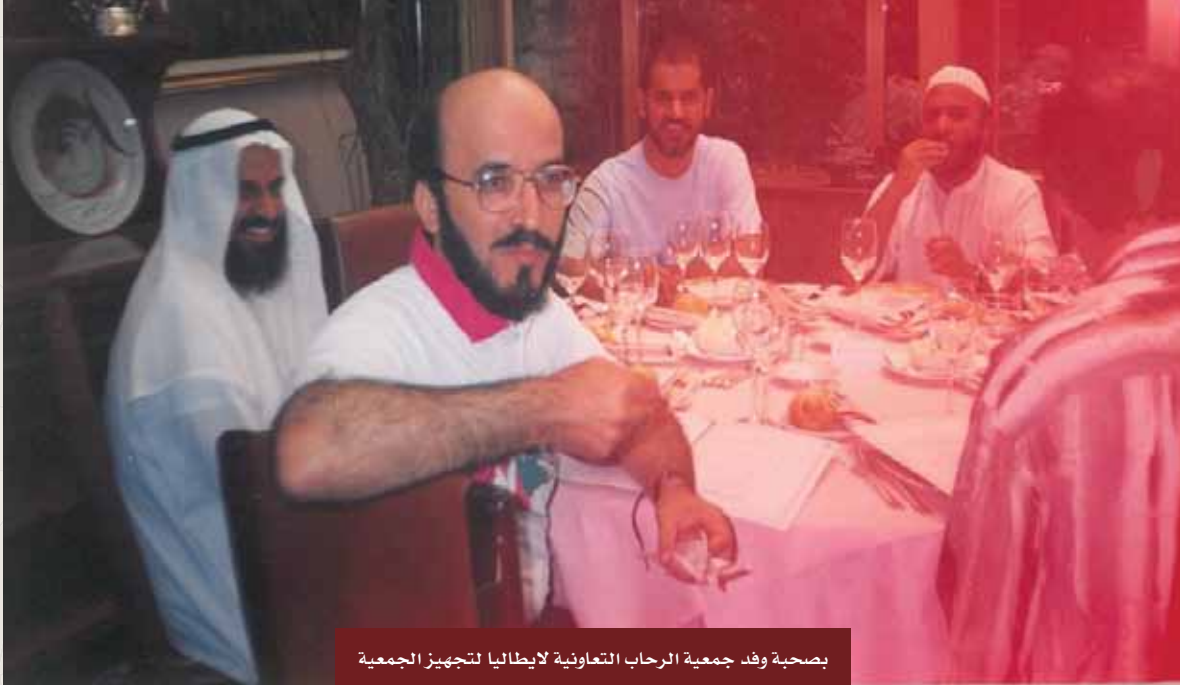
بصحبة وفد جمعية الرحاب التعاونية لايطاليا لتجهيز الجمعية

السلام عليك يا من له الفضل بعد الله تعالى في وجودي، إلى من رباني صغيرة، إلى من فقدت بفقده أبا كريماً وحبیباً، إلى من سألت الله أن يرزقني الله بره في مماته.