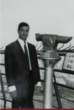
في برج القاهرة في الستينات