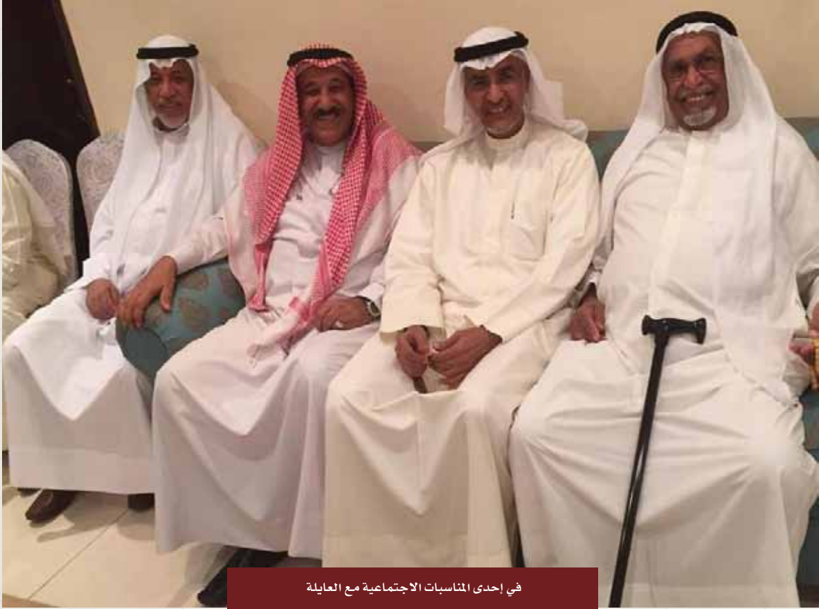
في إحدى المناسبات الاجتماعية مع العائلة

آن لك يا أخي أن تنام قرير العين، طيب الله مرقدك، وطيب الله ثراك، وجعل الجنة مثواك، فهناك الملتقى مع الحبيب المصطفى صلى الله عليه وسلم، أسأل الله العظيم أن يلم شملنا في الفردوس الأعلى، وأن يلهمنا الصبر على فراقك، وينزل السكينة على قلوبنا، اللهم آمين.