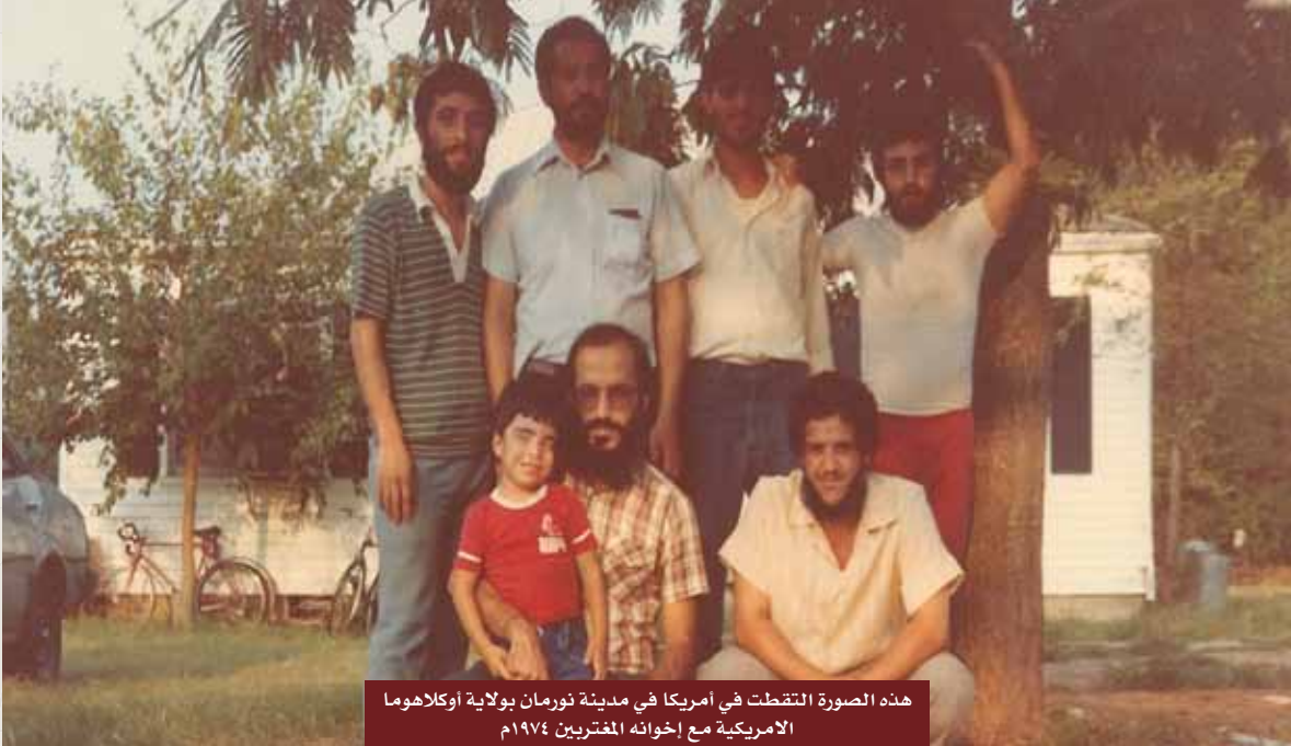
هذه الصورة التقطت في أمريكا في مدينة نورمان بولاية أوكلاهوما الأمريكية مع إخوانه المغتربين ١٩٧٤م

عايشت كثيراً من قيادات العمل الإسلامي في العالم، لكن من النادر جداً جداً أن ألقى إنساناً صافي القلب تماماً، أحمد الأنصاري -رحمه الله- من هذا النوع، عايشته على مدى سنين، لم أجد يوماً أنه قد يكون عنده هم دنيا أو الشيء في نفسه على أحد أو الرغبة في الظهور، أو حتى عتب على تقصير تجاهه، هذه روح نادرة، والروح النادرة الصافية لا يمكن إلا أن تترك بصمة في قلب الإنسان لا تنسى، فرحمة الله على أخي، ويجمعنا به في الفردوس مع أهله الصالحين مع النبي صلى الله عليه وسلم.