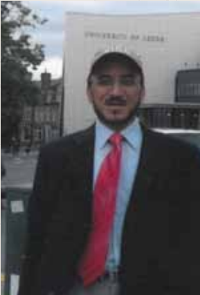
في احد المؤتمرات العلمية (بريطانيا) ٢٠١٣م