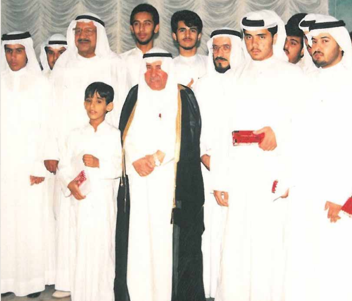
في حفل تكريم المتفوقين الذي اقامته جمعية الرحاب بصالة افراح الفروانية و بحضور محافظ الفروانية آنذاك العم ابراهيم جاسم المصنف