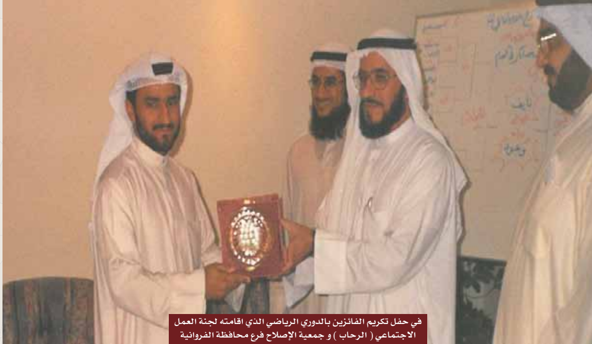
في حفل تكريم الفائزين بالدوري الرياضي الذي اقامته لجنة العمل الاجتماعي ( الرحاب ) و جمعية الإصلاح فرع محافظة الضروانية

اللهم أبدل والدي الحبيب داراً خيراً من داره، وأهلاً خيراً من أهله، واجبر كسر قلوبنا بفقدته، واجمعنا به في فردوسك الأعلى.