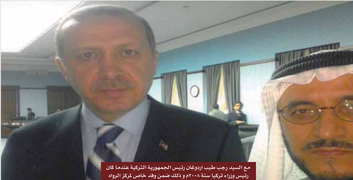
مع السيد رجب طيب اردوغان رئيس الجمهورية التركية عندما كان رئيس وزراء تركيا سنة ٢٠٠٨م و ذلك ضمن وفد خاص لمركز الرواد