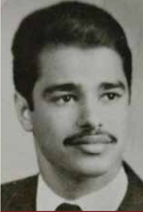
مساعد أيام الشباب

منذ عرفت الحياة وهو أخي الذي يكبرني وصديقي منذ وفاة والدي، وكان قدوة حسنة لي، وأطول الناس صحبة لي في هذه الحياة حتى توفاه الله حيث افتقدته كثيراً، كان أخي وصديقي في الرحلات والسفر والحج، وكان ينصحني ويوجهني منذ الصغر.