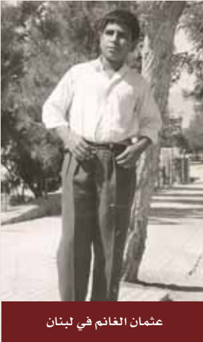
عثمان الغانم في لبنان