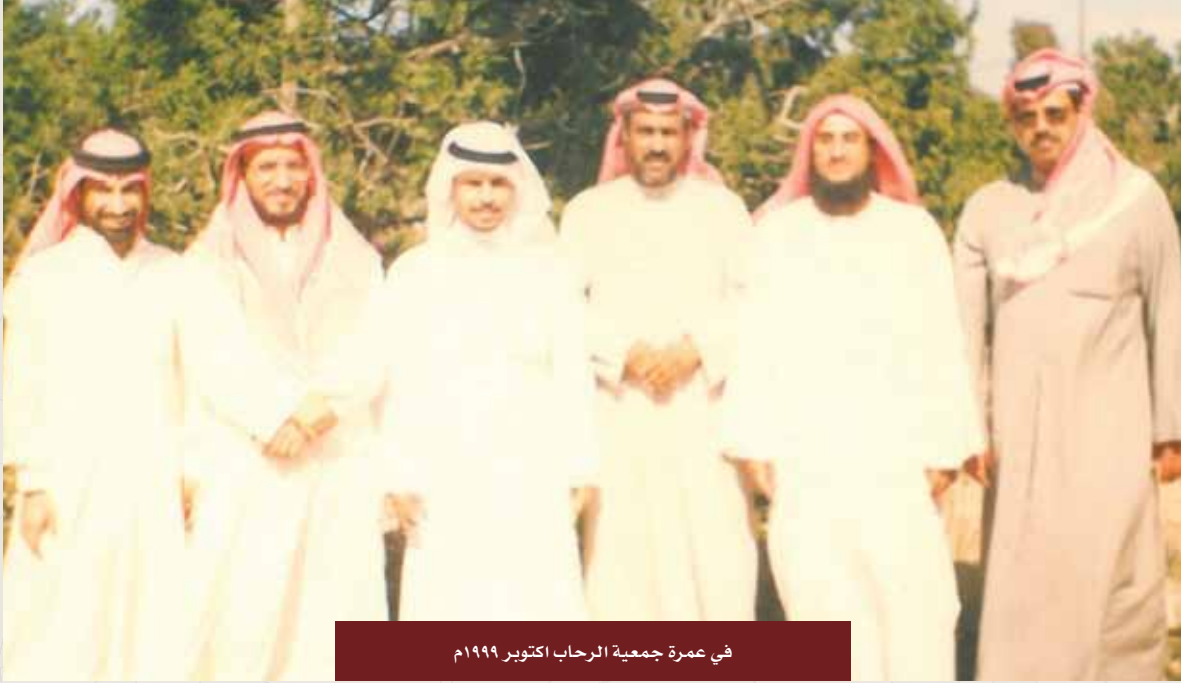
في عمرة جمعية الرحاب أكتوبر ١٩٩٩م

كانت لي فرصة الاحتكاك به بشكل كبير أثناء عمادته للقبول والتسجيل في الهيئة العامة للتعليم التطبيقي والتدريب، كان مثلاً للجدية والإنصاف والحيادية، وعندما تكون هناك مشكلات في التسجيل يلجؤون إليه، وكان دائماً يحلها بصدور رحب؛ لأن هذا الموقع مليء بالأخطاء والتدخلات ومحاولات تحريك العلامات أو مواعيد رصد الدرجات، كان يتفهم ذلك، وكم مرة ذهبت لمكتبه، والحقيقة أقول له: بيض الله وجهك؛ لأنه كان يحل مشكلات معقدة كثيراً من البيروقراطيين