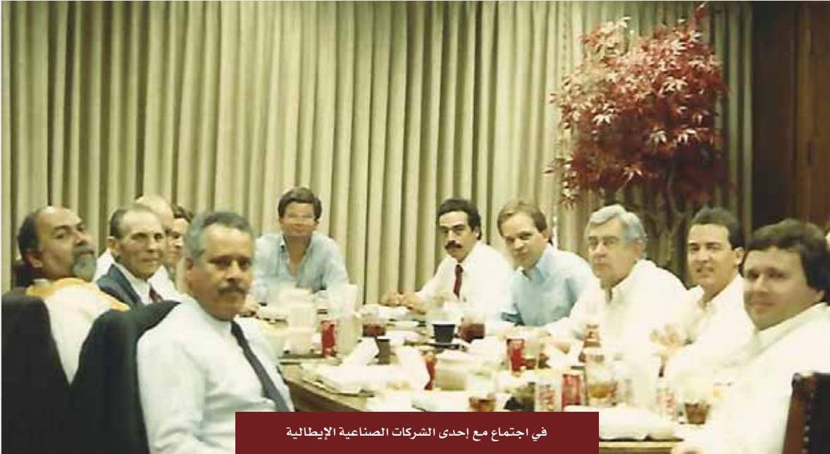
في اجتماع مع إحدى الشركات الصناعية الإيطالية