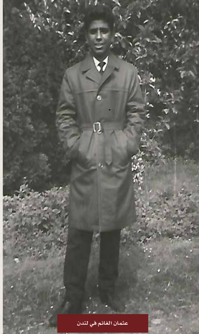
عثمان الغانم في لندن