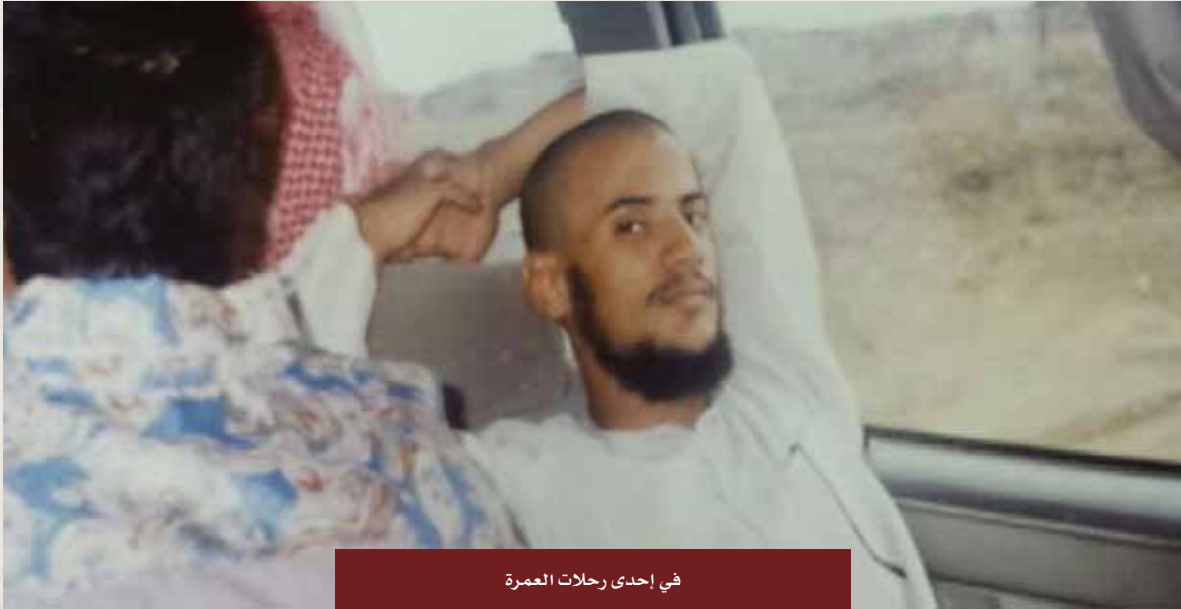
في إحدى رحلات العمرة

"كل من عليها فان، ويبقى وجه ربك ذو الجلال والإكرام".