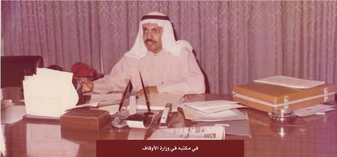
في مكتبه في وزارة الأوقاف

وانتقل بعدها إلى وزارة الأوقاف والشؤون الإسلامية، وعين مديراً بمكتب الوزير العم يوسف الحجى -شافاه الله وعافاه- ثم مديراً للعلاقات العامة والإعلام، ومديراً لإدارة المسجد الكبير حتى تقاعده في عام ٢٠٠١م.