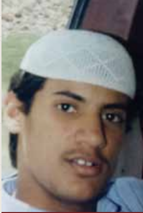
في إحدى رحلات العمرة

قديماً قالوا: إن لكل إنسان نصيباً من اسمه.