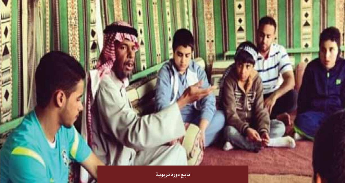
تابع دورة تربية

وكذلك كان من أبرز هواياته عمل المسابقات وإدارتها، وكذلك الخط، والرسم، والزراعة، وكان يرسم بالمجان للمدارس.